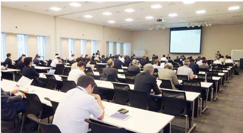
衆議院議員会館大会議室でのワークショップ(冒頭説明中の筆者)

このような内外の調査を踏まえて、立法府とアカデミアの関係のあり方について国会議員と意見交換を行うためワークショップを昨年の6月に衆議院第一議員会館で試行的に行いました(写真)。議員側からは、①選挙で選ばれた国会議員の正統性と科学の真理にかかわる正当性のバランスを政策立案にあたってどう確立していくか、②気候変動、医療、年金問題など科学的助言を必要とする課題が国会でも多くなって